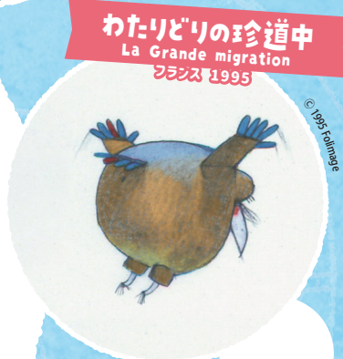
わたりどりの珍道中 La Grande migration フランス 1995