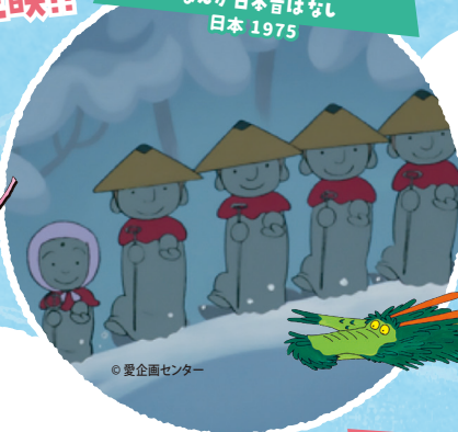
かさじぞう まんが日本昔ばなし 日本 1975