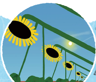
ひまわり Tournesol フランス/ロシア 2023