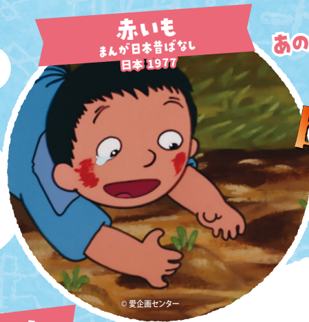
赤いも まんが日本昔ばなし 日本 1977