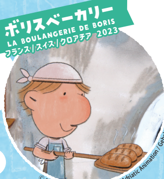
ボリスベーカリー LA BOULANGERIE DE BORIS フランス/スイス/クロアチア 2023