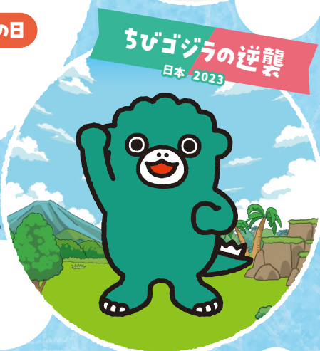
ちびゴジラの逆襲 日本 2023