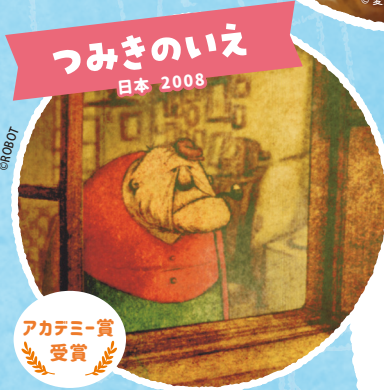
つみきのいせ 日本 2008